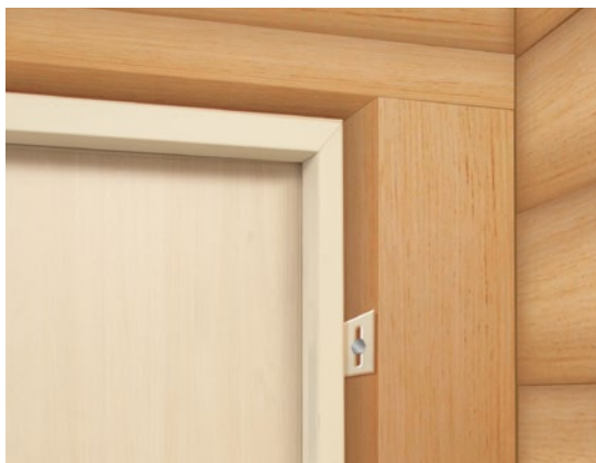
Схема установки стальной двери в деревянном доме

Обратите внимание: Если в процессе осадки и эксплуатации здания геометрия дверных проемов меняется, возникшие в результате нарушения функционирования стальной двери ЛЕГАНЗА не являются гарантийным случаем. Установка входной двери ЛЕГАНЗА в деревянном доме производится только в готовый проем, расширение таких проемов нами не выполняются. При отказе заказчика подготовить под установку стальной двери ЛЕГАНЗА в деревянном строении дверной проем с обсадой и компенсационным зазором поверху обсаженного проема, наша фирма вправе отказать заказчику в заключении договора.